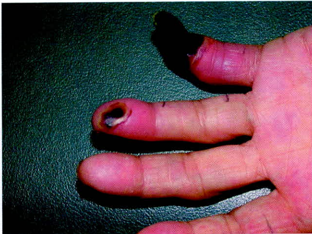
Fig. 1. Digital gangrene on Left 4th and 5th finger tips with mummification.

일 전에는 좌측 제 4, 제 5 수지의 말단부위에 괴사가 발생하여 (Fig. 1), 본원 내과로 입원하여 진단과정 중에 있었다. 과거력 상 약 5년 전부터 항고혈압약제를 투약하고 있었고, 약 2년 전 폐결핵으로 항결핵제 투약 도중 약 2개월 만에 중단한 경력이 있었다. 가족력 상에는 특이소견은 없었다. 외견상 매우 여위어 보였으며 좌측 제4, 제5지의 원위지절간 관절 이하 부위에 괴사된 부위가 관찰된 이외에 특이한 점은 없었다. 신경학적검사상 근력은 좌측 고관절의 외전근이 도수근력검사상 Fair+등급으로 감소되어 있었으며 이외의 근육들에서는 정상적인 근력을 보였다. 감각저하는 없었고, 심부건반사는 정상적이었으며, 상부신