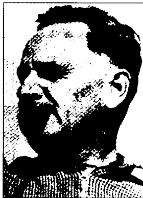
〈그림 1〉 C. O. 사우어(1889~1975)

이러한 배경을 살펴보자면, 우선은 한국내의 지리학 연구자들이 주로 현지조사와 관련된 연구주제나 혹은 지리학의 이론적·실증적 연구주제에만 관심을 갖는 성향 때문이라고 말할 수 있다. 나아가, 기회가 있을 때마다 외국의 새로운 이론과 법칙은 수용하면서도 진작 그 이론이나 법칙을 수립한 학자에 대해서는 별 관심을 갖지 않는 국내의 연구풍토와도 관련된다 할 수 있을 것이다. 외국의 저명한 학자에 대한 소개와 평가는 한사람의 연구영역을 구체적으로 확인하고, 그가 주로 행하던 연구 방법론을 수용하거나 원용함으로써 새로운 변화와 방향을 모색할 수 있다는 점에서 매우 중요한 작업이라 할 수 있다. 이러한 취지를 바탕으로, 본고에서는 사우어가 남긴 중요한 업적과 지리적 사상, 그리고 그가 지도한 문학생들과 더불어 지칭되고 있는 버클리(Berkeley) 학파의 문화지리학적 특성 등을 주요 내용으로 삼아 논의를 전개해 보고자 한다.