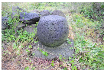
&lt;도 20&gt; 泰岩寺址 浮屠(向右)

石鼓로도 소개되었지만 전체적인 치석 수법과 양식으로 보아 부도가 분명한 것으로 보인다. 모두 대석과 圓球形 탐신이 한 돌로 제작되었으며, 동일한 양식을 보이고 있어 비슷한 시기에 건립되었을 것으로 보인다. 다만 부도의 주인공이 동일인인지 각각 다른 승려인지 알 수 없다. 부도의 대석은 평면 사각형으로 간략하게 마련되었으며, 원구형 탐신은 상면에 별도의 낮은 받침대 흔적이 있는 것으로 보아 원래는 屋蓋形의 蓋石이 결구되었음을 알 수 있다(도 19, 20). 태암사지 부도는 규모가 작고, 치석 수법과 양식 등이 조선후기의 부도들과 친연성을 보이고 있다.