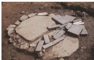
<도 3> 水精寺址 靑石塔址 15)

한편 수정사지 청석탑은 결실된 부재가 많아 전체 層數를 구체적으로 파악하기는 어렵지만 ‘七’과 ‘南’이라고 글자가 새겨진 塔身石 부재가 있어 최소 7層 이상의 탑이었음을 알 수 있다(도 6). 그런데 7層 南面에 결구되었던 탑신석보다 규모가 작은 부재가 확인되고 있어, 수정사지 청석탑은 9층이나 11층이었을 가능성이 높은 것으로 추정된다. 14) 현재 수정사지 청석탑의 조성 시기는 관련 기록이 없고, 편년을 설정하는데 양식적으로 중요한 옥개석이 발견되지 않아 어려운 점이 있다. 그러나 청석탑이 고려시대 들어와 일반적으로 건립되었으며, 탑신 표면에 범자로 쓴 眞言 陀羅尼를 새긴 점 등으로 보아 수정사지 청석탑은 고려후기에 건립되었을 것으로 보인다.