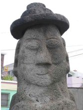
<도 25> 東資福 相好