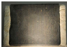
<도 4> 水精寺址 靑石塔材 (1층 塔身石, 국립제주박물관 소장)