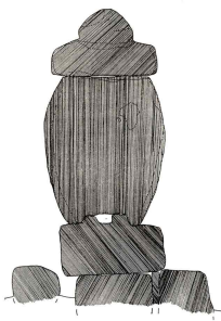
<도 17> 尊者庵 浮屠 圖面 28)