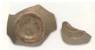
<도 10> 元堂寺址 출토 청자편 19)