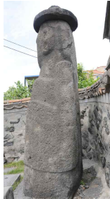
<도 22> 東資福 側面