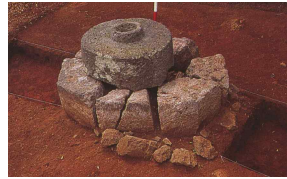
<도 18> 尊者庵 浮屠 基壇部 29)

리고 옥개는 처마면을 두툼하게 마련하고 표면에 별다른 장식을 하지 않아 佛頭 위의 寶蓋石처럼 다듬었으며, 옥개 상부에는 반원형의 큼직한 寶珠를 올려 마무리하였다. 존자암 부도는 세부적으로 간략화 된 치석과 결구 수법이 적용되었지만 전체적으로 각 부재들 간에 비율이 잘 어울리고 있어 전형적인 원구형 부도로서 안정된 인상을 주고 있다. 이러한 점은 이 부도가 당시 육지에서 성행한 양식에 대하여 잘 알고 있는 상당히 우수한 석공에 의하여 설계 시공되었음을 알 수 있게 한다. 존자암 부도는 조선 후기 부도들과 양식적으로 친연성을 보이고 있는데, 치석 수법과 양식으로 보아 17~18세기 대에 건립된 것으로 보인다.