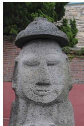
<도 27> 西資福 相好