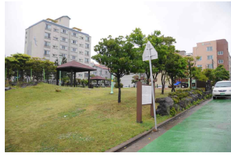
<도 2> 水精寺址 전경(2014년)

다(도 1). 이러한 것으로 보아 수정사는 늦어도 고려초기에는 창건되었으며, 이후 중창을 거듭하면서 조선후기까지 범등이 지속되었음을 알 수 있다. 11)