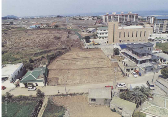
<도 1> 水精寺址 발굴 조사 항공사진 10)