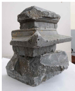
<도 31> 襄陽 道寂寺址 青石塔材

에 2字, 상층부에 활용된 작은 塔身의 표면에는 1字씩 새겼다. 현재 고려시대 청석탑 중에서 범자로 진언 다라니를 새긴 예는 原州 普門寺 青石塔, 寧越 武陵里 青石塔, 襄陽 道寂寺址 青石塔材 44) 등에서 확인되는 상당히 드문 사례에 속한다(도 29~31). 수정사지 청석탑의 탑신에 새겨진 범자체는 고려와 조선시대 일반적으로 쓰인 悉曇體로 原州 普門寺 青石塔과 상당히 유사하다. 그런데 결실된 탑신 부재가 많아 어떤 진언 다라니를 새겼는지는 파악하기 어려운 상태이다. 다만 고려시대 들어와 遼와 元나라 불교의 영향으로 密敎가 유행하면서 진언 다라니가 성행하게 되는데, 이러한 시대적 배경 속에서 수정사지 청석탑도 신앙과 예불의 대상으로 진언 다라니를 새긴 고급스러운 청석탑을 조성했던 것으로 보인다. 이와 같이 수정사지 청석탑에 새겨진 진언 다라니는 한국 불교사에서 고려시대 불교의 密敎的인 요소를 직접적으로 보여주는 대표적인 사례라는 점에서 미술사적으로 중요한 의의가 있다고 할 수 있다.