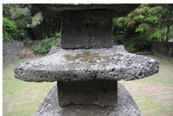
<도 14> 元堂寺址 五層石塔 1층 옥개석

탑신부의 탑신석과 옥개석은 표면에 별다른 장식없이 평범한 치석 수법을 보이고 있다. 다만 1층 탑신 정면의 한가운데에 사각형 龕室을 마련했는데, 그 규모로 보아 소형 佛像이나 舍利具를 봉안하기 위한 시설로 보인다. 그리고 감실 입구 외곽에 일정한 너비의 돌을대가 마련된 것으로 보아 처음에는 별도의 감실 막음장치가 있었는데, 어느 시기에 결실된 것으로 추정된다(도 13). 그리고 각 층의 탑신석은 隅柱가 표현되지 않은 石柱形 기둥처럼 치석했는데, 각 층의 탑신이 상부로 올라가면서 좁게 다듬어 배흘림 수법이 약하게 적용되었음을 알 수 있다. 또한 석탑의 전체적인 외관을 결정짓는 옥개석은 각 층의 규모는 다르지만 동일한 양식으로 치석되었다. 다만 1층 옥개석이 다른 층에 비하여 다소 넓고, 5층 옥개석이 4층에 비하여 체감 비율이 상대적으로 커서 약간 불균형적인 모습을 보이기는 하지만 오층석탑의 전체적인 비례와 외관에는 크게 영향을 미치지 않고 있다. 옥개석은 落水面이 완만한 경사를 이루고 있으며, 합각부의 처마를 살짝 치켜 올리면서 약간의 反轉을 주어, 두툼한 처마면이 줄 수 있는 둔중한 이미지를 최대한 완화시켜 경쾌한 인상을 주도록 한 점은 돋보이는 치석 수법이라 할 수 있다. 옥개석 상면의 합각부 모서리에는 일정한 너비의 돌을대를 처마부까지 길게 마련하였는데, 옥개석이 기본적으로 목조건축물의 지붕부를 번안했음을 보여주고 있다(도 14, 15). 그리고 옥개석의 하부 모서리에는 風鐸을 달았던 흔적이 남아 있어, 원래는 모서리마다 풍탁이 달렸었음을 알 수 있다. 다만 우리나라 석탑에서 일반적으로 표현되는 옥개석의 상하부에 받침이나 괴임단을 마련하지 않은 측면, 두툼한 처마면의 처리, 어색한 합각