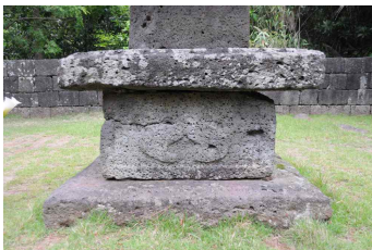
<도 12> 元堂寺址 五層石塔 기단부

석탑 기단부는 단층기단으로 낮게 마련되었는데, 하대석 상면은 외곽부를 경사지게 다듬어 다소나마 장식적인 기교로 치석되었다. 그리고 그 위에 올린 기단부 面石은 한 돌로 마련되었는데, 후면을 제외한 정면과 양측면의 3면은 외곽부에 일정한 너비의 돌을대를 마련하여 사각형으로 구획한 후, 그 안에 眼象을 새겼다(도 12). 안상의 한 가운데에는 음각으로 花紋形 紋樣을 추가적으로 장식하였다. 이와 같이 안상 안에 花紋을 추가적으로 장식하는 표현 기법은 고려시대 석조미술에 많이 적용되었다. 그런데 원당사지 오층석탑의 안상은 음각으로만 표현되는 다른 석조미술품의 안상과는 달리 볼륨감있게 陽刻함으로써 面石의 표면에서 상당히 돋보이게 하였다. 이러한 점은 화강암에 비하여 치석하기 쉬운 玄武巖이라는 재질의 특수성보다는 面石部에서 안상을 돋보이게 장식하려는 석공의 세심한 기교로 보인다. 그리고 면석 위에 놓인 甲石은 하면에 별도의 附椽을 표현하지 않았으며, 상면은 외곽부를 일정한 너비로 구획하여 약간 경사지게 다듬어 하대석과 마찬가지로의 치석 기법을 적용하였다. 22) 또한 甲石 上面은 약간 경사지게 다듬고 낮은 단이 형성되도록 하여 넓은 탑신괴임처럼 보이도록 치석했다. 이와 같이 갑석 하부에 일반적으로 마련되는 附椽을 표현하지 않았으며, 그 上面에 1층 塔身을 받치는 괴임대가 표현되지 않은 점 등은 간략화의 경향이 진전된 시기에 이