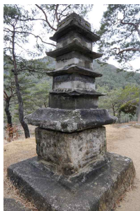
<도 30> 寧越 武陵里 青石塔