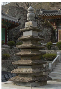
<도 29> 原州 普門寺 青石塔