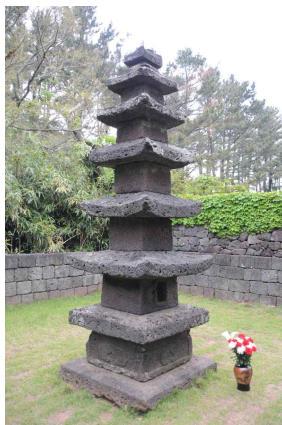
<도 11> 元堂寺址 五層石塔 전경

추정되었으며, 청자편들은 11~12세기 대에 걸쳐 생산된 고급 강진청자들과 친연성이 있는 것으로 확인되었다. 20) 즉, 원당사의 初創 時期가 원나라 奇皇后와 관련된 창건 연기보다 더 오래되었음을 알 수 있다. 이러한 것으로 보아 원당사는 늦어도 고려초기에는 창건되어 범등을 잇다가 고려후기에 와서 크게 중창되었던 것으로 보인다.