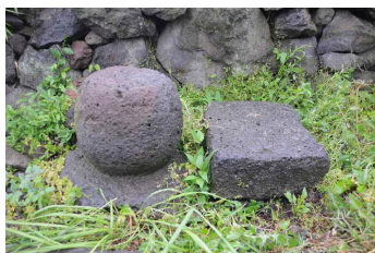
&lt;도 19&gt; 泰岩寺址 浮屠(向左)