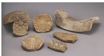
<도 9> 元堂寺址 출토 막새 18)