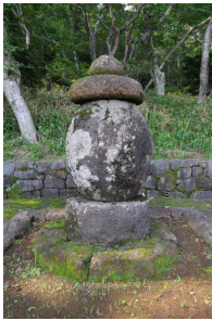
<도 16> 尊者庵 浮屠