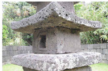
<도 13> 元堂寺址 五層石塔 1층 탑신부