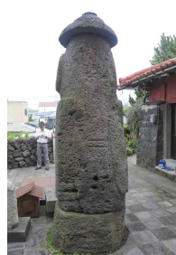
<도 24> 西資福 後面