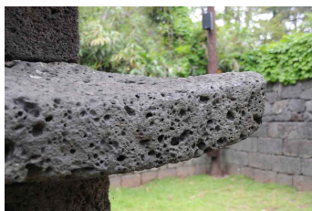
<도 15> 元堂寺址 五層石塔 2층 옥개석