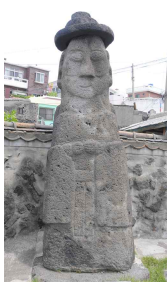
<도 21> 東資福 正面

각상은 그 규모로 보아 육지에서 화강암으로 조성되었다 해도 상당히 큰 대형 석불이라 할 수 있다. 그런데 육지가 아닌 제주지역에서 동자복과 서자복 규모의 조각상을 조성하기 위한 대형 玄武巖은 제주지역에서 採石하기도 상당히 어려울 뿐만 아니라, 조각하기도 만만치 않았을 것이다. 이러한 것으로 보아 두 조각상은 당시 제주지역에 살고 있었던 유력한 계층들을 비롯하여 상당히 많은 사람들이 후원하여 조성된 것은 분명한 것으로 보인다. 이와 같이 제주지역의 다양한 상황과 조선초기 불교계의 동향, 東資福과 西資福의 조각 기법과 양식 등 여러 요소들을 고려할 때, 두 조각상은 제주지역에서 불교가 중심적인 종교로 자리 잡았던 조선초기인 15세기대에 조성되었을 것으로 추정된다. 41)