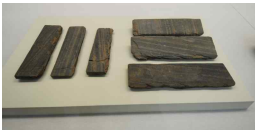
<도 5> 水精寺址 靑石塔材 (塔身石, 국립제주박물관 소장)