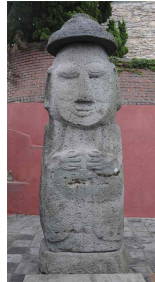
<도 23> 西資福 正面