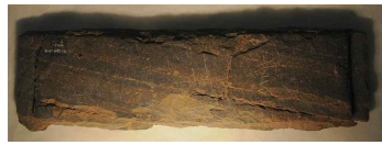
<도 6> 水精寺址 靑石塔材 (7층 남면 塔身石, 좌측에 ‘七’, 우측에 ‘南’이라고 음각, 국립제주박물관 소장)