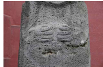
<도 28> 西資福 手印