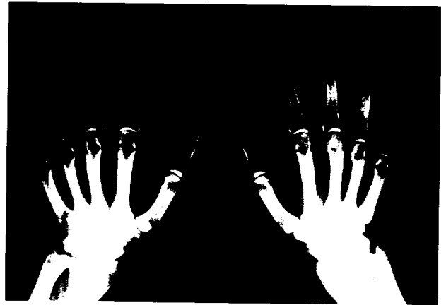
Fig. 1. A roentgenogram of both hands reveals juxtaarticular osteoporosis in carpal bones, MCP joints.

임상경과: 내원 7개월전부터 지속된 한시간이상의 조조경직, 3개 이상의 관절에서 동시에 관절염이 관찰되었고 연부조직의 종창 및 압통, 근위 손가락뼈사이관절, 중수지절, 손목관절의 수부관절염, 대칭성 관절염, 높은 류마티스인자 역가, 방사선 상 중수지절 주변의 탈석회화를 보여 미국 류마티스 학회 진단 기준에 합