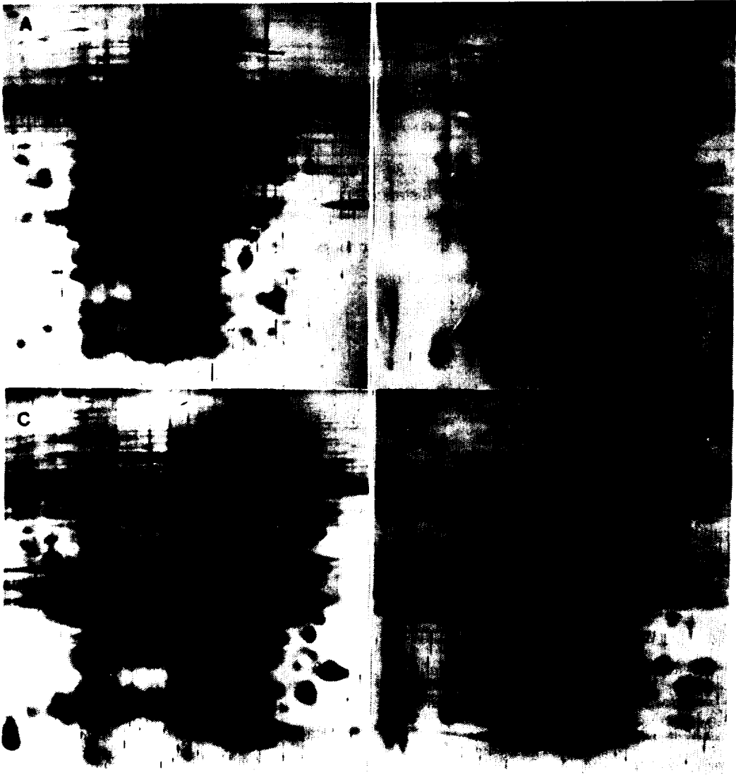
Figure 2. Two-dimensional gel electrophoretic patterns in 4 species of Goodyera . The proteins were detected by silver staining. A, G. velutina ; B, G. maximowiczina ; C, G. schletendaliana ; D, G. macrantha .