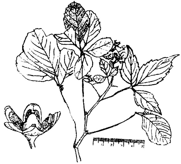
Fig. 2. Parthenocissus quinquefolia (L.) Planch.

닥 모양을 하고 있는 것도 있으며, 잎자루가 있고 가장자리에 톱니가 있다. 꽃은 원추꽃차례를 이루며 피고, 열매는 어두운 청색이고 2~3개의 종자가 들어 있다(이, 1996; Shimizu et al. 2005). 그러나 2006년 7월 13일 제주시 우도면 서광리에서 발견된 것은 원예용으로 재배하였던 것으로 생각된다(제주특별자치도 민속자연사박물관, 2006).