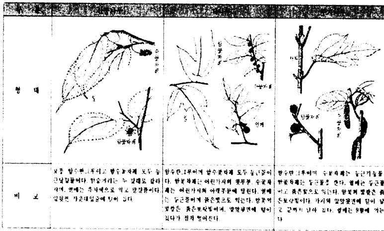
<그림 2> 수종 비교

마을지에 전한다. 28) 이 밖에도 닥나무를 식재한 기록이나 관련한 방언이 전하는 마을지로는 『명월향토지(2003)』·『용담동지(2001)』·『광령약사(1990)』·『김녕리향토지(1986)』·『평대리지(1990)』·『둔지오름(한동리지, 1997)』·『가스름(가시리지, 1988)』·『하례2리지(1994)』·『화순리지(2001)』·『판포리지(1995)』·『다라곳(월평동지, 2001)』·『이도2동지(2009)』·『하효지(2010)』 등에서 그 내용을 확인할 수 있었다.