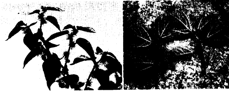
<그림 3> 제주 닥나무 잎과 열매(좌)/ 닥나무와 꾸지나무(우)

대한 내용이 주종을 이루고 있다. 이중 『하효지』에는 제지수공업과 관련한 자세한 내용이 전하고 있어 주목된다. 예부터 하효마을에서는 生楮나 면화를 원료로 하여 土紙 등을 생산하는 가내수공업이 있었다. 지역 내에 오랫동안 방치되었던 황무지를 개간하여 楮田을 확보하였고, 이를 원료로 제지나 명석, 초신, 망태기 등의 재료로 활용하였다고 한다. 29) 이와 함께 제지 과정도 상세하게 전하고 있어서 조선 전·후기 제주지역의 제지수공업 상황을 逆 추적할 수 있는 근거가 되지 않을까 생각된다.