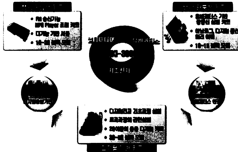
[그림 2] Diki-3000의 구성요소

Diki-3000은 디지털 기초 학습, MP3 Player 학습, 레이저 광통신 학습을 위한 기본 키트와 확장된 MCU(Micro Controller Unit) 프로그래밍 학습, 디지털 라이팅 학습, 무선통신 학습으로 구성되어 있다.