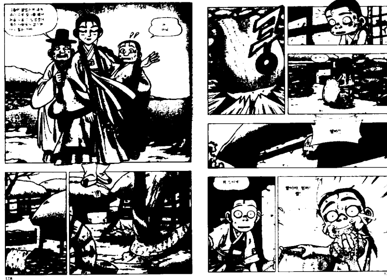
<그림 2> 박산하, 『조선최초의 여자거상 김만덕』, 178~79쪽.