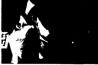
곳판, 섬스러운 공간

는 등근 원환을 이루고 있는 모습이며, 이러한 상징을 우리나라의 고신라시대를 포함하여 전 세계 어디서나 찾아볼 수 있다고 하고 있으며, 이러한 우주적 원형을 '알'로 보았다고 주장한다. 15)