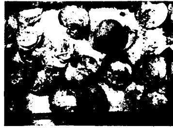
천마총에서 발굴된 꺼문기물품인 달갈

'알'과 관련하여 주목할 만한 무덤의 형태로 웅관묘를 생각해 볼 수 있다. 웅관묘는 삼국시대와 탐라국 시대에 어린아이의 시신을 항아리에 넣고 묻는 장법의 하나로, 항아리에 웅크린 어린아이의 모습은 마치 태중의 아이의 모습이라고 할 수 있을 것이다. 여기서의 항아리는 어린아이의 생명의 근원지였던 여성의 자궁을 형상화 한 것이라고 할 수 있으며, 이는 장묘문화가 갖는 재생이라는 기원을 담고 있는 것이다. 여성의 자궁에는 생명을 만들어내는 힘이 있을 것으로 여겼을 것이며, 이를 신성시하는 것은 지모신앙을 형성하게 되는 배경이 되었을 것이다.