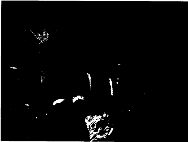
그림 6 제물 진설 모습

인 등의 순서가 오후에 집중되어 있기 때문이다. 제단청소는 제관 5명이 오후 3시에 제청을 출발하여 다녀온다. 제단 내의 낙엽은 물론 지난해 당에 오면서 올렸던 지전의 일부 중 훔탈린 것 등을 나무를 가지를 꺾어 만든 비로 쓸고 하여 모두 제거하였다. 그리고 향로에 넣을 숯불을 위해 좁은 나뭇가지도 주위 한 곳에 모아두었다. 30분 정도 소요되었다. 제단청소를 마치고 돌아온 대축(大祝)은 초헌관(初獻官)과 함께 지방과 축문을 작성하기 위해 종이를 준비한다. 그리고 초헌관이 보는 앞에서 작성해 나간다. 대축 이외의 제관들은 취모들을 도와 제물을 준비하거나 확인한다. 제물은 생것을 주로 사용함으로 사과 등 과일은 깨끗하게 닦아 두는 정도였다. 그리고 분향을 위해 향나무를 잘게 깨어 놓았다. 그리고 희생(犧牲)인 닭의 손질은 집례와 아헌관, 동회장이 맡았다.