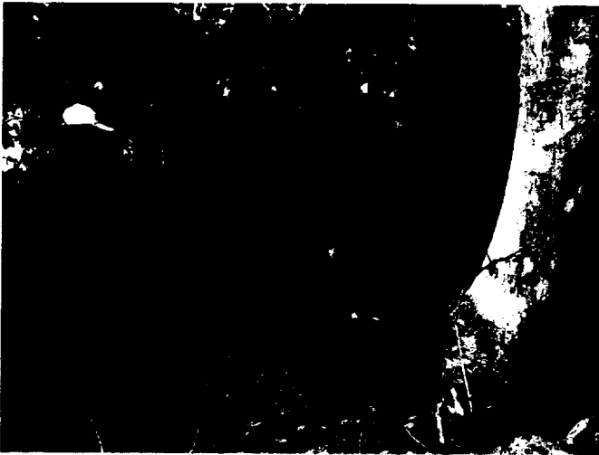
그림 3 제단청소

‘본향지신신위’(本郷之神神位)라는 지방(紙榜)을 작성하고 그것을 모신 다음 제의를 봉행하였다. 지방은 제청 입제 마지막날 제단 청소를 마친 다음 대축이 축을 작성할 때 함께 작성한다. 초헌관과 함께 지방(紙榜)과 축문(祝文)을 쓸 종이를 마름질하고 초헌관(初獻官)이 보는 앞에서 작성한다. 지방을 작성한 종이의 규격은 폭 5.8cm, 길이 27.5cm정도였으며, 축문의 규격은 폭 29.5cm, 길이 32.5cm정도의 것이었다.