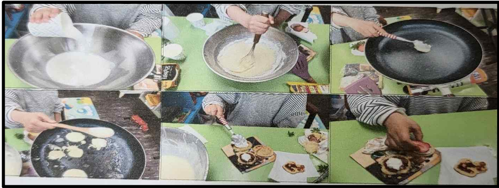
[그림 IV-7] 차레차레 만들어요