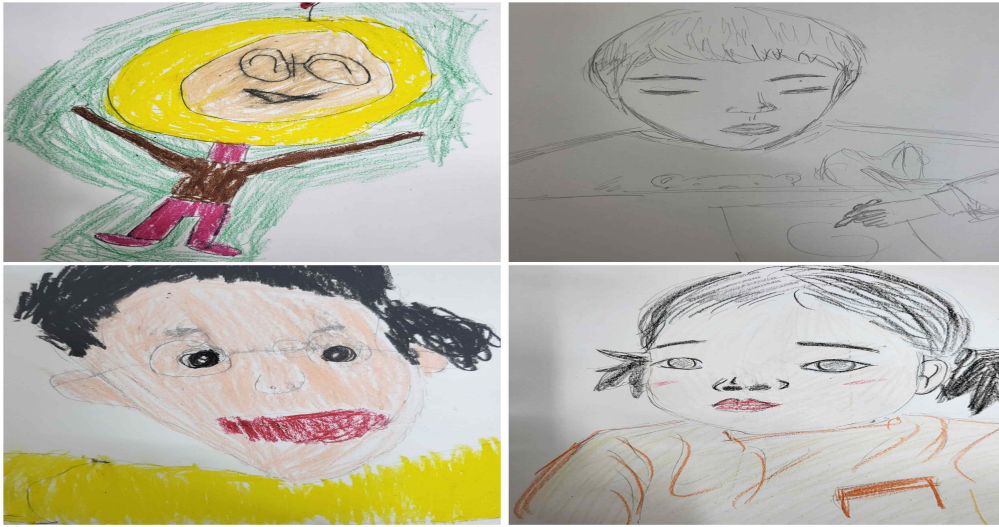
[그림 IV-4] 선생님과 대상 아동 A와 B