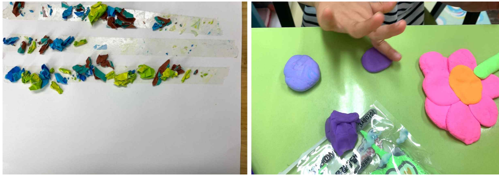
[그림 IV-5] 클레이로 만들어요