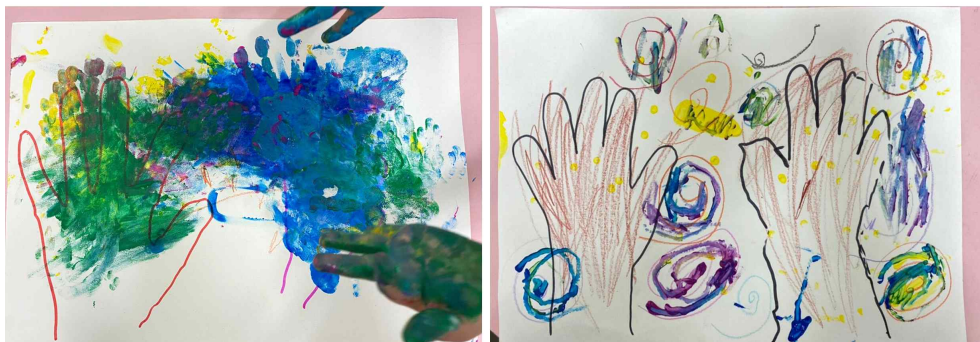
[그림IV-3] 손을 그려요.

두 대상자와 인사하기를 시도하였다. “선생님과 인사해야지”라고 말하니 연구자를 보지 않고 고개를 숙였다. 연구자가 B아동의 손을 잡고 “눈, 선생님 눈 봐야지” 하니 반향어로 “눈”이라 말하고 얼굴을 돌렸다. A아동은 손바닥으로 자기 머리를 때리며 괴성과 함께 자리에서 경충경충 뛰었다. 바람직하지 못한 행동에 강화를 주지 않음으로써 반응의 강도 및 출현 빈도를 감소시키는 일종의 소거(extinction) 기술에 해당하는 타임아웃(time-out)을 실시하였다. “치료실 밖에 있다가 선생님과 그림 그리고 싶을 때 들어와”라고 하였다. 잠시 후 담당 활동지원사가 “A아동이 치료실에 들어오고 싶어 한다”고 말했다. A아동에게 선생님 눈을 보고 인사한 후 자리에 가서 앉으라고 하였다. 짧은 순간 연구자의 얼굴을 보면서 “아아아시아”라 말하며 머리를 끄덕이고 자리에 앉았다. 두 참가자는 자기 손을 그리면서 재미있어하고, 그려진 그림을 좋아하는 모습을 보였다. 그러나 상대방의 손을 그리면서는 서로를 때리고 깨물고 도화지를 찢었다. 지난 회기에 1차 강화물로 사용했던 간식을 보여주면서 주지 않겠다고 말한 후, 서로를 안아주고 다시 자기 손과 친구 손을 그리면 주겠다고 설명했다. B아동은 바로 자리에 앉아 자기 손을 그리고 A아동에게 “손, 손” 하며 A아동의 손을 끝었다. A아동은 연구자의 눈치를 보며 잠시 멈칫하였으나 B아동의 도화지에 손을 올렸다. B아동이 간식을 받아 가는 모습을 보고 A아동도 자리에 앉아 자기 손을 그리고 간식을 재촉했다. “친구 손도 그려야지”라고 말하니 친구의 손을 끌어와 그림을 그린 후 간식을 즐겼다. “잘했다”라는 칭찬과 함께 1차 강화물을 나누었다.