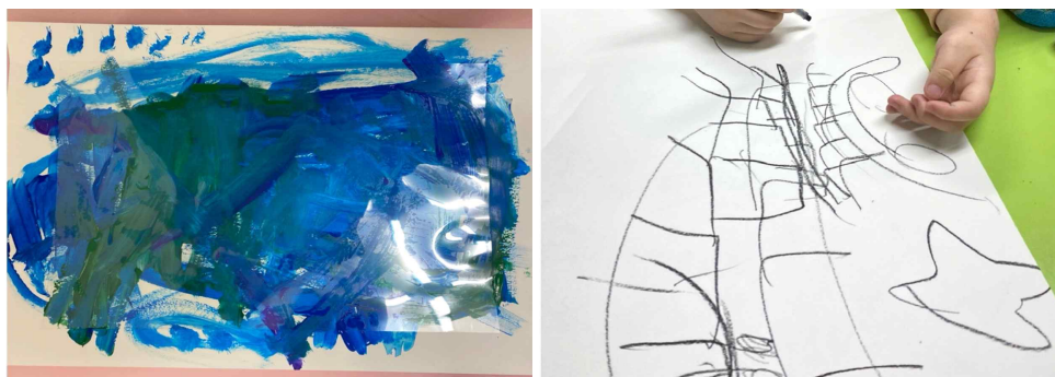
[그림 IV-2] 자유화

대상자들은 강화물로 준비한 간식을 보고 거부감과 반항 없이 자신의 의자에 앉았다. 아동들은 간식을 먹고 자유롭게 그림을 그렸다. 1회기 때보다 거부감은 없었다. 그러나 지시가 내려지지 않는 상황에서 자발적인 행동에는 어려움을 보였다. 연구자가 연필을 잡고 낙서하듯 그림을 그리자, 모방 행동이 나타났다. [그림 IV-2]는 완성하지 못하였다. 두 아동은 여전히 산만하고 착석이 5분 이상 유지되지 않았다.