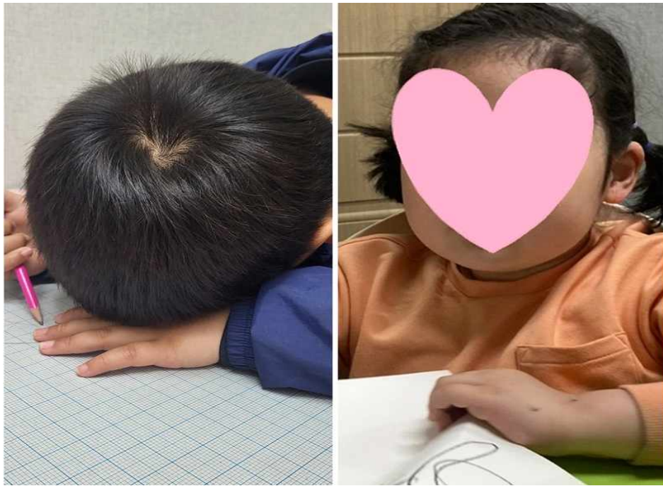
[그림 Ⅲ-1] 연구대상자 A아동과 B아동

미술치료 프로그램이 발달장애아동의 사회성 및 도전적 행동에 미치는 영향을 알아보기 위하여 서귀포 M발달재활센터를 이용하는 발달장애아동을 연구 대상으로 하였다. 발달장애아동과 보호자 및 기관 관계자들에게 연구의 목적과 미술치료 프로그램 구성 내용과 이용 방법에 대하여 구두 설명과 함께 설명서를 제공하였고, 본인과 보호자의 자발적인 참여 의사를 득하였다. 대상자의 정보는 주로 기관장, 대상아동 보호자와 주 양육자와 면담을 진행하며 연구자의 관찰로 수집하였으며, 연구 참여자는 [그림 Ⅲ-1]이며, 특성은 <표 Ⅲ-1>과 같다.