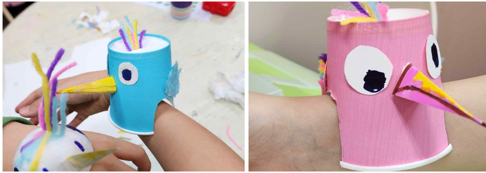
[그림 IV-6] 종이컵으로 만들어 보아요