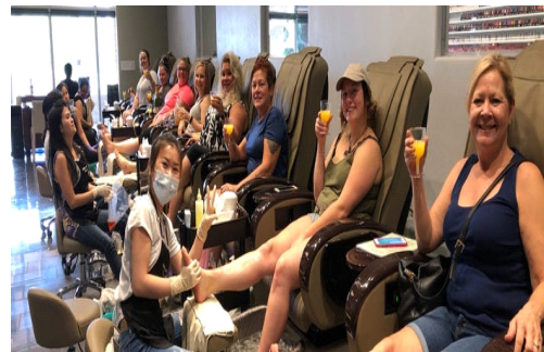
50) <그림 I-10> 네일 미용여가 활동2