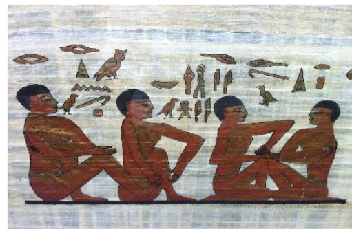
<그림 I-1> 고대 이집트의 마사지 벽화

33)