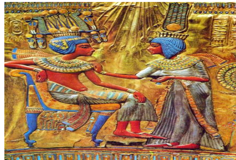
<그림 I-5> 고대 이집트 헤어관리 벽화