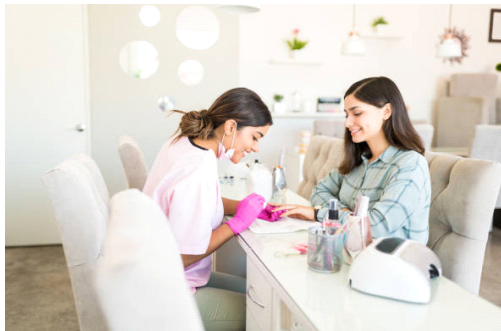
49) <그림 I-9> 네일 미용여가 활동1

매니큐어는 기원전 3500년경 고대 이집트 피라미드에서 왕비의 손톱에 사용 한 우드스틱, 금속성 도구, 바르는 약과들이 발견되었다. 이집트에서는 헤나 가루로 손톱에 붉은 오렌지색으로 염색하였다. 귀신을 쫓고 주술적인 의미와 사치, 쾌락의 상징이 되었다. 손톱의 색이 사회적 지위를 나타내고 왕과 왕비는 짙은 색이고 신분이 낮을수록 점점 옅은 색을 하였다. 중국에서는 홍화의 재배로 입술연지와 손톱에 사용하였고 아라비아 고무나무를 이용하여 꿀과 계란흰자를 사용하였는데 오늘날의 에나멜이라 할 수 있다. 48) 아래 <그림 I-9>와 <그림 I-10>은 현재의 네일 미용여가 활동을 즐겁게 하고 있는 장면이다.