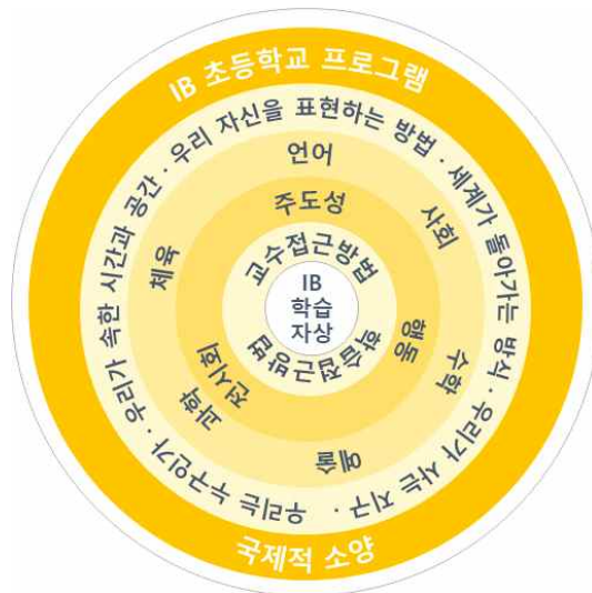
[그림 II-1] IB PYP 프레임워크

한다. PYP 학생들은 탐구를 통해 학습하고 자신의 학습을 반성함으로써 지식, 개념적 이해, 기술 및 IB 학습자상을 발전시켜 자신의 삶, 공동체 및 그 너머에서 차이를 만든다. 이 프레임워크는 학습자(The learner), 학습과 가르침(Learning and teaching), 학습 공동체(The learning community)로 이루어진 학교 생활의 세 가지 축을 뒷받침하는 주도성의 중심 원칙을 강조한다. IB PYP의 프레임워크를 도식화하면 [그림 II-1]과 같다(IBO 홈페이지).