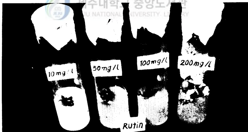
Photo 3. Growth responses of Cymbidium virescens rhizome to the several concentrations of anti-oxidants.