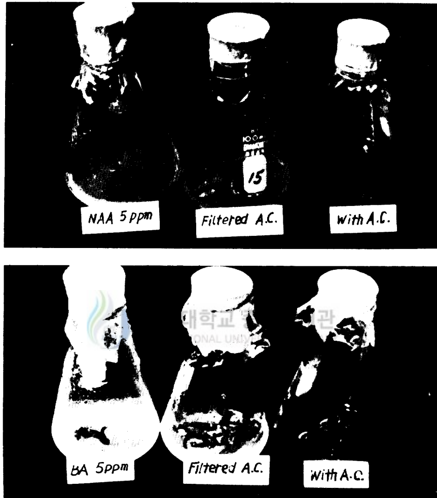
Photo 2. Growth response of Cymbidium virescens rhizome to the activated charcoal treatment in the MS medium with NAA or BA 5ppm respectively.

根莖의 길이는 측지 發生數와 關係가 있는 것으로 나타나고 있는데 (Table 2) 이는 活性炭에 의하여 光線이 遮斷 되었을 때는 橫的인 伸張이 誘導되어 根莖의 길이가 길어지는 現象을 나타내었으며, 活性炭이 添加되지 않은 培地에서는 光線에 對한 忌避現象으로서 측지를 多量發生 하였지 않았는가 여겨졌다.