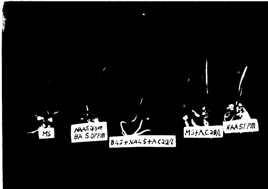
Photo 1. Comparison of various rooting agent treatments on the Cymbidium virescens plantlets in vitro .

培養植物이 排出하는 代謝分泌物 즉 phenol 物質들을 吸收하므로 生育과 發根이 促進되는 것인지, 혹은 活性炭의 黑色粒子들이 培地の 자체를 검게하여 光源을 遮斷 하므로서 發育이 良好하게 되는지의 興否에 의문점을 示唆하였다.