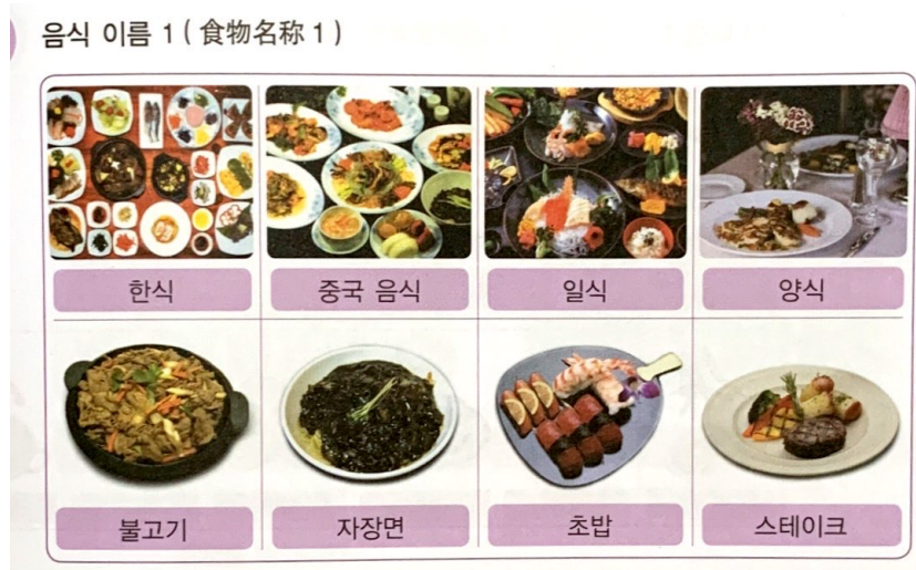
<표5> 연세대학교 『연세한국어(2급)』에서의 어휘 예시

위의 예시는 연세대학교 한국어 교재 2급 제4과 ‘음식’과 관련된 어휘 부분에서 나오는 교육용 어휘 및 그림이다. 육아 어휘로서 ‘양식’, ‘초밥’, ‘스테이크’는 연관성이 좀 떨어지므로 취급하지 않기로 한다. ‘중국 음식’ 같은 경우는 한 단어가 아니고, ‘중국’ 같은 나라 명칭은 ‘육아’ 분야와 별 상관이 없으므로 그러한 어휘들은 본고의 연구 범위에서 제외하기로 한다. 따라서 위 <표5>에서 제시된 어휘 가운데 ‘한식’, ‘일식’, ‘불고기’, ‘자장면’을 본고의 연구 대상으로 선정된다. 이와 같은 과정을 거쳐 연세대학교 한국어학당 교재에서 육아와 관련된 어휘는 초급 75개, 중급 16개, 고급 16개, 총 107개를 선정했다.