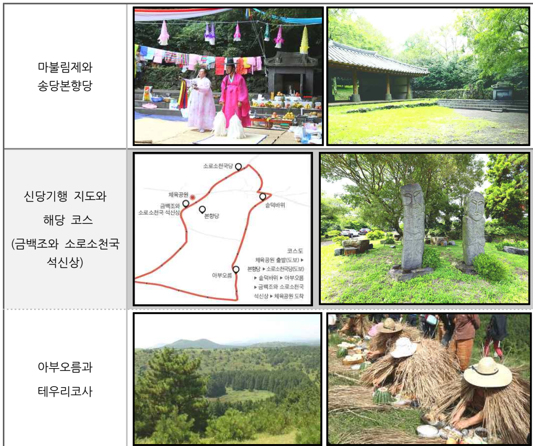
(그림 6) 송당마불림제 프로그램 진행 장소

아부오름(앞오름)에서 진행된 <테우리코사>는 전통적으로 목축이 행해졌고, 현재도 목장이 운영되는 곳이다. 핵심 프로그램 중 하나인 ‘신당기행’은 마을해설사와 함께 마을길을 걸으며 마을공동체의 생성과 변화 과정을 마을의 신화와 연결하여 해석할 수 있도록 구성된 프로그램이다. ‘땃블리기’와 그 외의 프로그램들은 당주차장이나 체육공원 등을 비롯해 마을 일대에서 진행되었다.