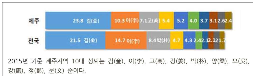
〈표 6〉 제주지역 10대 성씨 구성비 (2015년 현재)

탐라의 개국 신화와 관련이 있는 장소에서 제주도의 번영과 안녕을 기원하며 치루는 행사인 만큼 그 가치를 제대로 계승하기 위해서는 현재의 상황에 맞게 참여의 범위와 내용이 재구성될 필요가 있다. 현재 제주의 인적 구성비를 고려하여 보다 열린 의례로 만들어가고, 미래 세대들이 공감할 수 있는 활동들과 연계하는 방안을 논의하는 등의 변화가 필요해 보인다. 84)