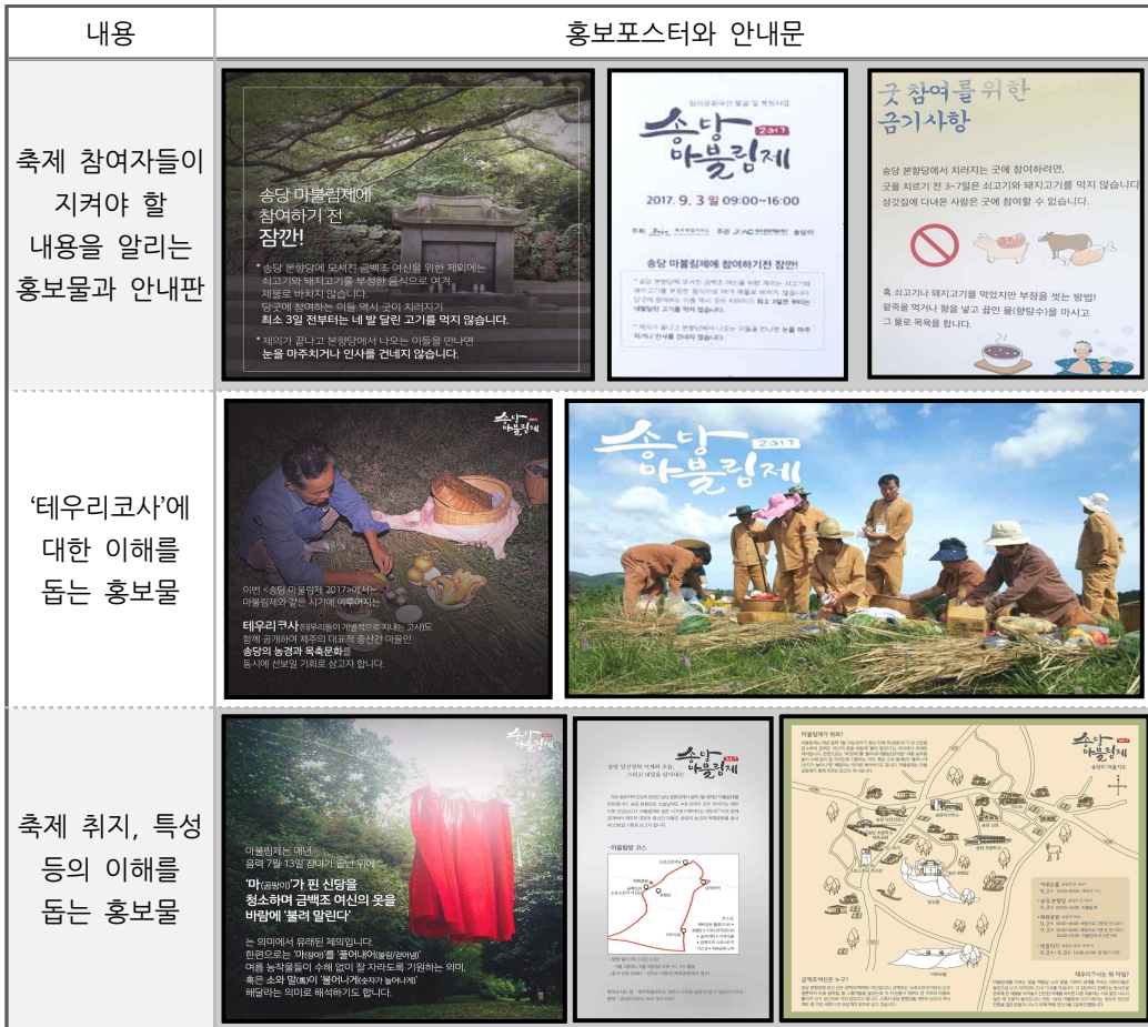
(그림 4) 송당마블림제를 이해하기 쉽게 만든 홍보물

축제 홍보물도 다양하게 제작하여 적극적인 홍보에 나서고 있으며, 문화유산을 제대로 전승하고자 하는 취지에 맞게 관람객들이 지켜야 할 예의나 주의사항 등도 알리고 있다. 축제 현장에서 관람객들이 지역의 전통을 전승하는데 적극적 참여자가 될 수 있도록 지켜야 할 예절 등이 적힌 안내문을 설치하였다. 다양한 홍보물과 안내문은 제주의 무속신화가 여전히 지역 주민들의 삶에 영향을 미치고 있음을 이해하도록 돕는다. 관람객들은 이를 통해 제주신화가 여전히 살아 있음을 느낄 수 있고, 신화의 내용을 보다 잘 이해할 수 있을 것이다.