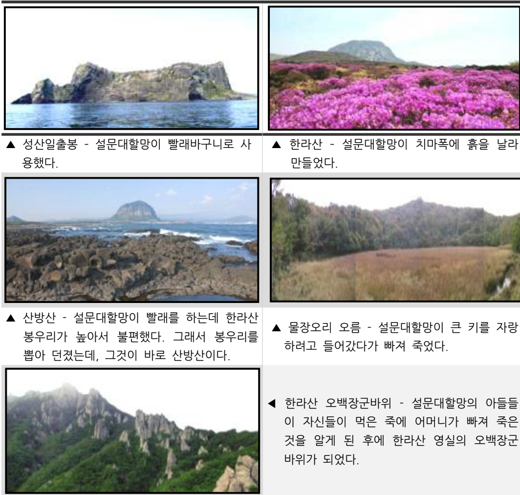
(그림 3) 실제 설문대할망 신화 관련 장소

장소로서 나름의 타당성을 인정받을 수 있을 것이다. 그러나 설문대할망 신화는 제주의 지형과 밀접하게 관련된 것으로 신화소에 해당하는 실제 장소가 존재한다. 따라서 이 부분에서는 신화의 원형에 부합하는 장소 진정성을 인정받기 힘들다.