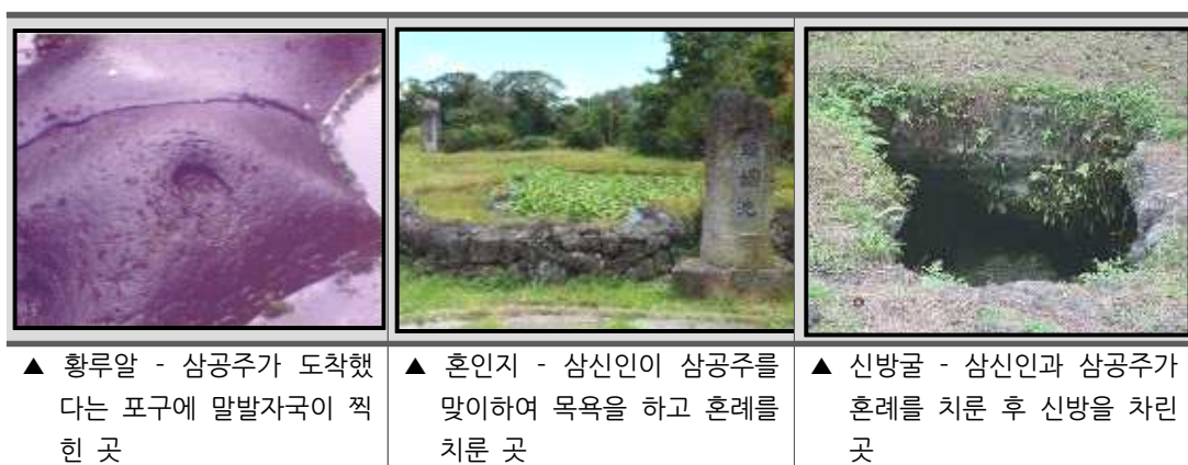
(그림 7) 온평혼인지축제 진행 장소

온평리는 <탐라개국신화>와 연관된 마을로, 설촌을 거론할 때는 반드시 ‘혼인지’부터 이야기되고 있다. 혼인지는 ‘혼죽’이라 일컬어지는 연못으로, 삼신인(三神人)이 바다 건너 온 벽랑국 세 공주를 맞아 목욕을 하고 혼인을 올렸다는 신화의 장소이다. 근처에는 삼신인과 삼공주가 저마다 신방을 차렸다는 동굴 ‘신방굴’이 있다.