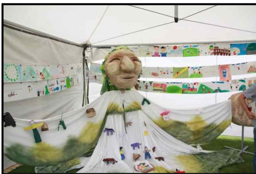
자료 : 송당초등학교 학생들 합동작품(2017년)

‘금백조님은 어디계실까?’를 진행하였다. 이 활동을 통해 금백조 여신을 형상화한 거대인형이 축제 현장에 전시되었다.