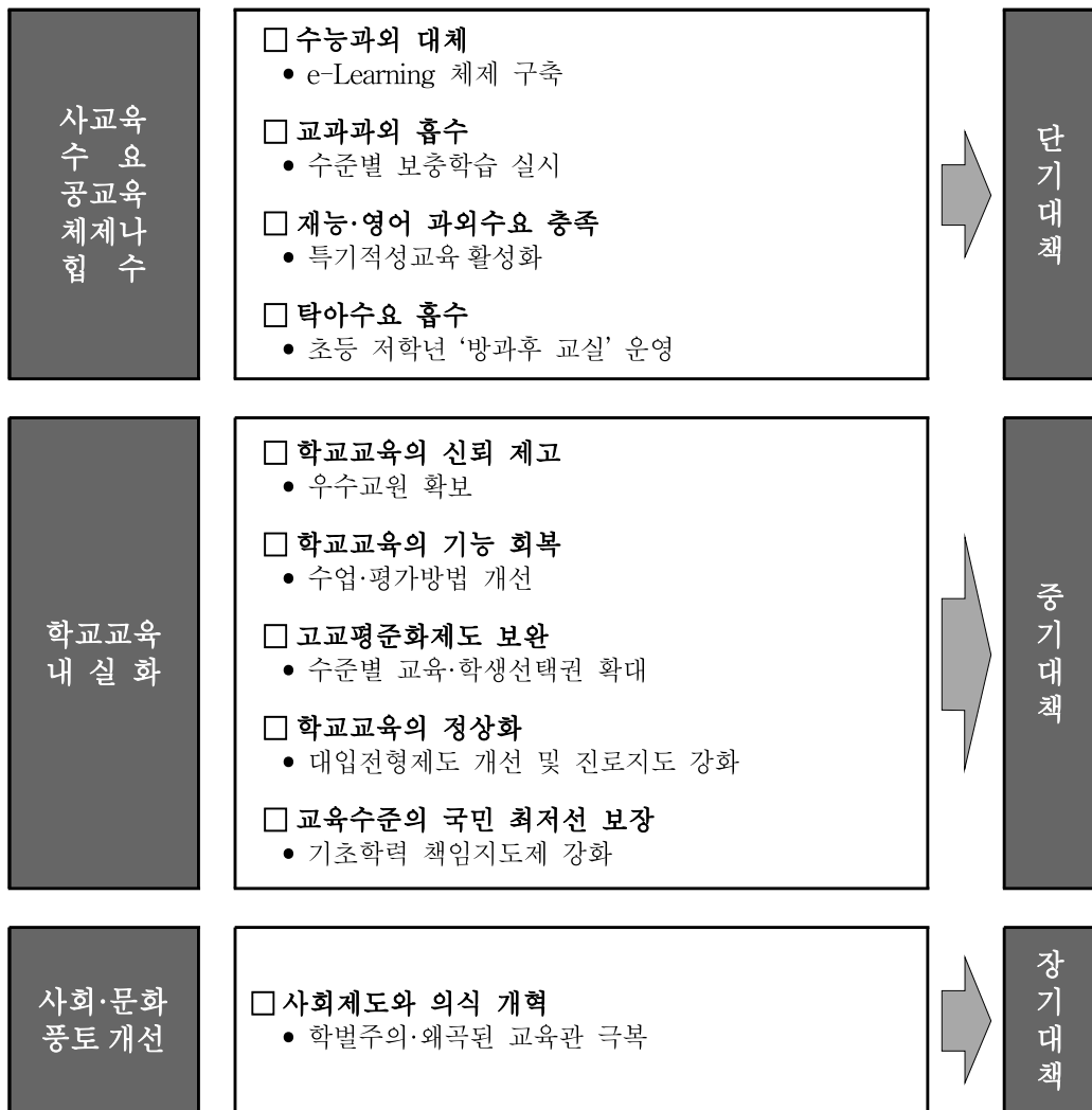
[그림 II-2] 분야별 추진과제