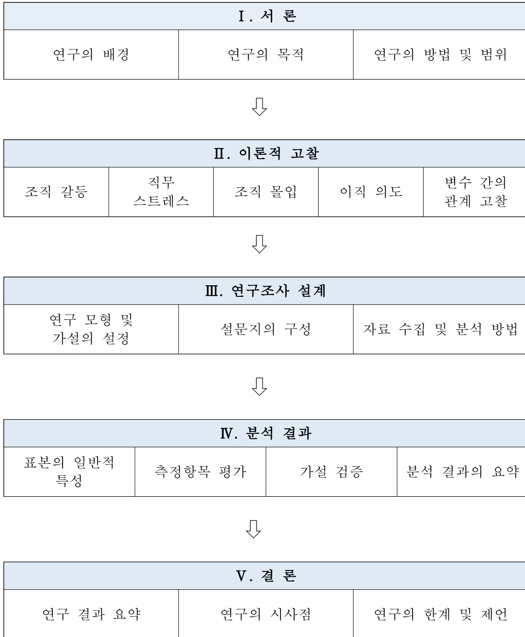
<그림 1-1> 연구의 흐름