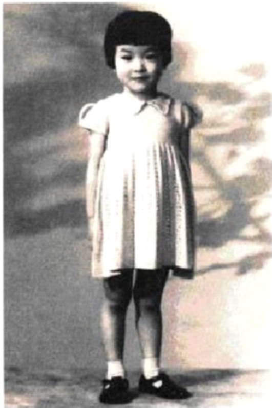
(좌) 아웬이 5살때