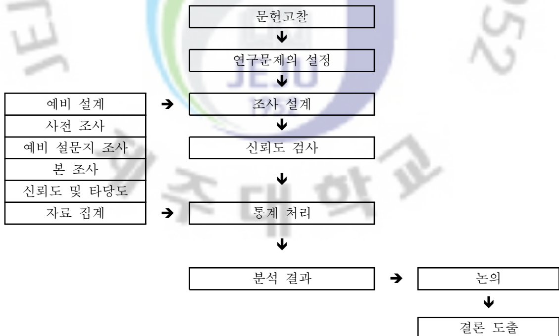
<그림 2> 연구의 절차

참여자들은 자기 평가 기입법(self-administration method)으로 설문지를 작성하였으며, 작성된 설문지를 가지고 신뢰성이 떨어지거나 신빙성이 없다고 판단되는 표본은 제외하였으며, 본 연구자가 유효 표본 20부를 대상으로 하여 자료 분석에 이용하였다. 조사는 2010년 4월 중에 진행되었다. 본 연구의 절차는 <그림 2>과 같다.