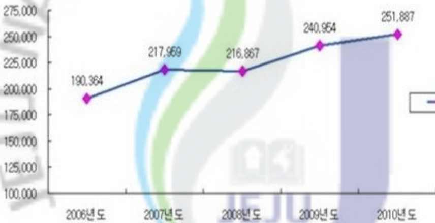
<그림 1> 연도별 주한 외국인 유학생 수 그래프

이것은 외국 학생들의 우리나라에 대한 관심과 외국인 유치정책 그리고 국내 대학의 적극적인 외국인 유학생 유치활동이 맞물린 결과라 하겠다. 특히, 최근 열풍 및 경제성장 모범 국가로서의 우리나라에 대한 관심이 고조되면서 중국뿐만 아니라 중앙아시아 지역 학생들의 한국 유학에 대한 선호도가 급격히 증가하고 있기 때문인 것으로 판단된다(교육과학기술부, 2006).