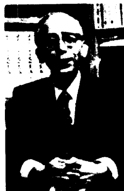
만년의 하타다 다카시

구의 선구자가 되었다는 사실이다. 그 계기가 된 것은 그가 한국 전쟁 중에 쓴 『조선사(朝鮮史)』(1951)였다. 하타다는 이 책에서 전전(戰前)의 조선사 연구를 비판하며 새로운 조선사 연구의 방향을 제시하고 나아가 남북통일의 염원을 담았다. 이어서 그는 '조선사연구회'의 창립(1959)을 위해 노력했고, 새로운 조선사 연구에 힘을 기울였다. 그러던 중에 '고마쓰가와(小松川) 사건의 범인으로 체포되어 사형선고