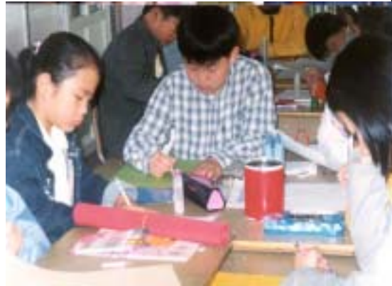
<그림12> 작품 계획서 작성