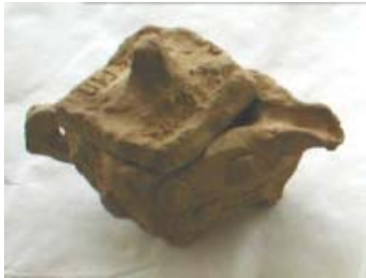
<그림5> 판으로 만들기