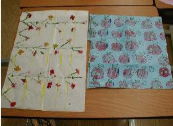
<그림7> 포장지 꾸미기