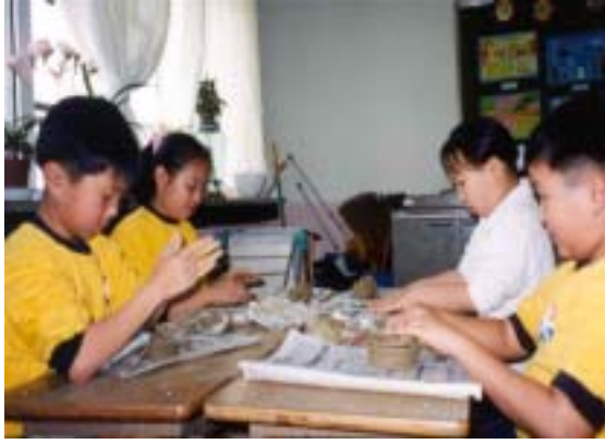
<그림2> 그릇 만들기