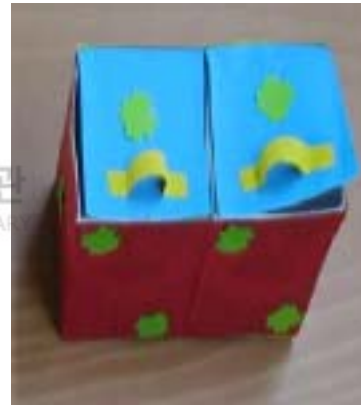
<그림11> 포장용기 만들기