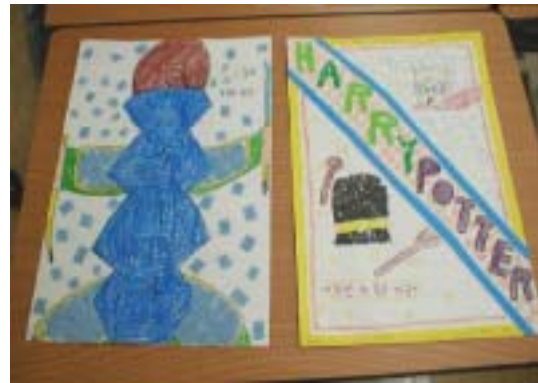
<그림15> 포스터와 가족신문 꾸미기