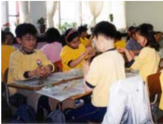
<그림1> 그릇 만드는 방법 익히기