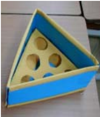
<그림9> 포장용기 만들기