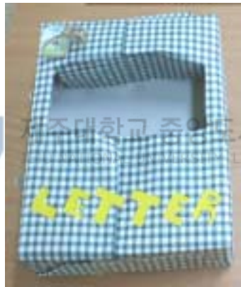
<그림10> 포장용기 만들기