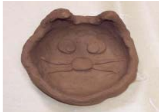
<그림4> 빚어서 만들기