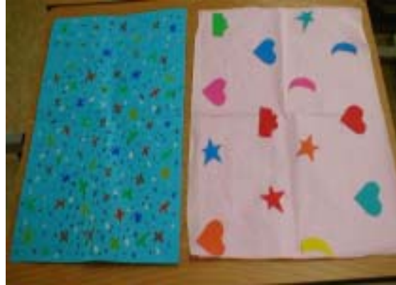
<그림8> 포장지 꾸미기