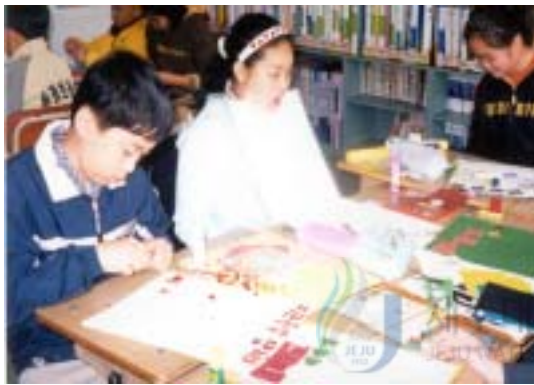
<그림 13> 알리는 것 꾸미기