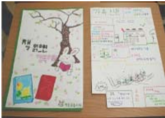
<그림14> 포스터와 가족신문 꾸미기