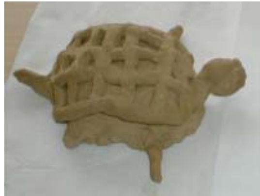
<그림6> 판으로 만들기과 빚어서만들기 응용