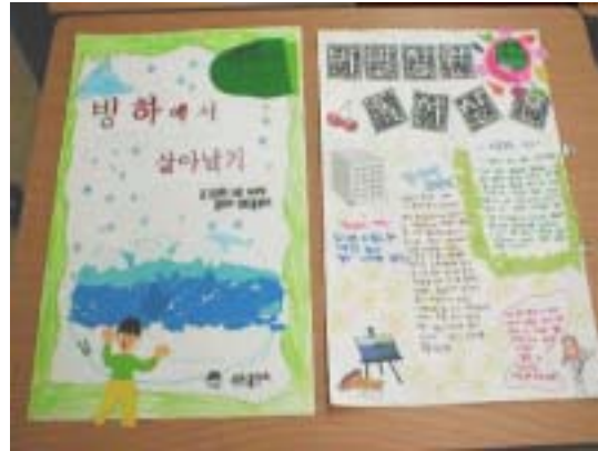
<그림16> 책표지 꾸미기