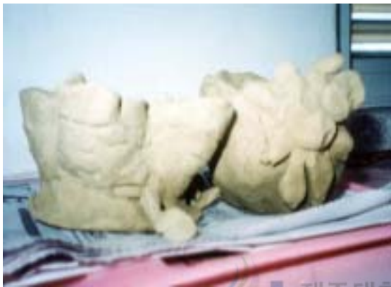
<그림3> 말아서 만들기