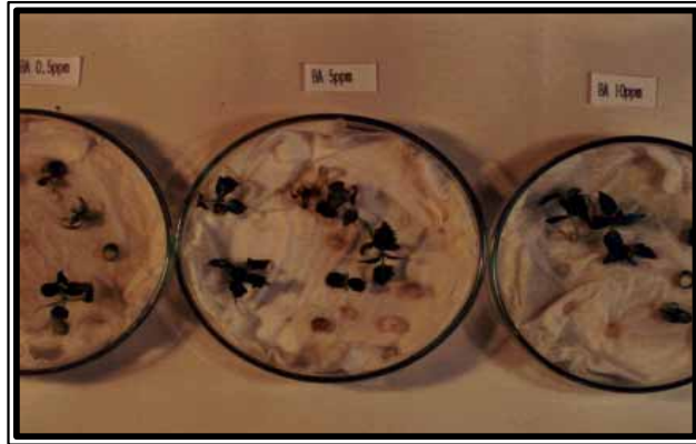
Photo. 2. Germination status to BA concentration from seeds removed inner seedcoat of P. yedoensis .

모든 처리구가 공통적으로 농도가 높아질수록 발아율 및 발근율이 점차 감소되었으며, 발아가 되었더라도 유묘가 짧고 굵으며 뿌리가 성장하지 않는 특성을 보였는데 1,000 ppm BA를 처리하였을 때는 발아가 전혀 이루어지지 않았다. 그러므로 왕벚나무의 종자발아에는 5 ppm BA를 처리하여 발아를 유도시키는 것이 가장 효율적인 농도임을 알 수 있었다(Table 2, Photo. 2).