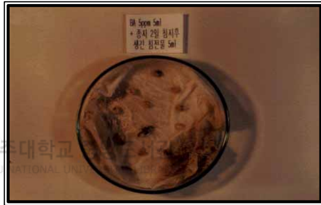
Photo. 3. Germination status from seeds attached inner seedcoat of P. yedoensis .

나무의 자연낙과 종자를 2~3개월 후에 채취하였을 경우에 거의 전량이 썩어버려 속이비는 현상이 관찰되는 것으로 보아 본 실험의 결과와 같이 채취 후 습윤 저장을 하거나 냉장저장 그리고 재빨리 내종피를 제거하여야만 휴면종자의 활성을 유지시킬 수 있을 것으로 판단된다.