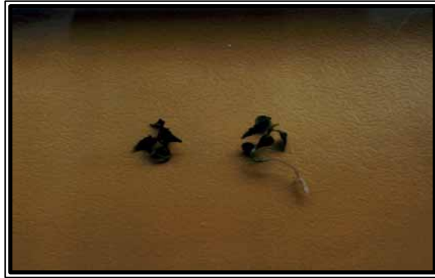
Photo. 4. Rooting status after seed germination on GA 3 treatment(left) and BA treatment(right) from seeds removed inner seedcoat of P. yedoensis .

등히 양호한 것으로 나타났다. 이에 반해 일반 발효에서 식재한 경우는 활착률이나 초장의 성장 등 모든 생육상태가 저조하였으며 부엽토, vermiculite, perlite 등의 다른 조건의 토양에서는 40~50% 활착률 보였고 초장 등의 성장 등 생육상태에 차이를 보이지 않았다.