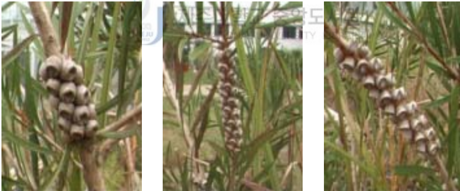
Fig. 1. Callistemon citrinus capsules