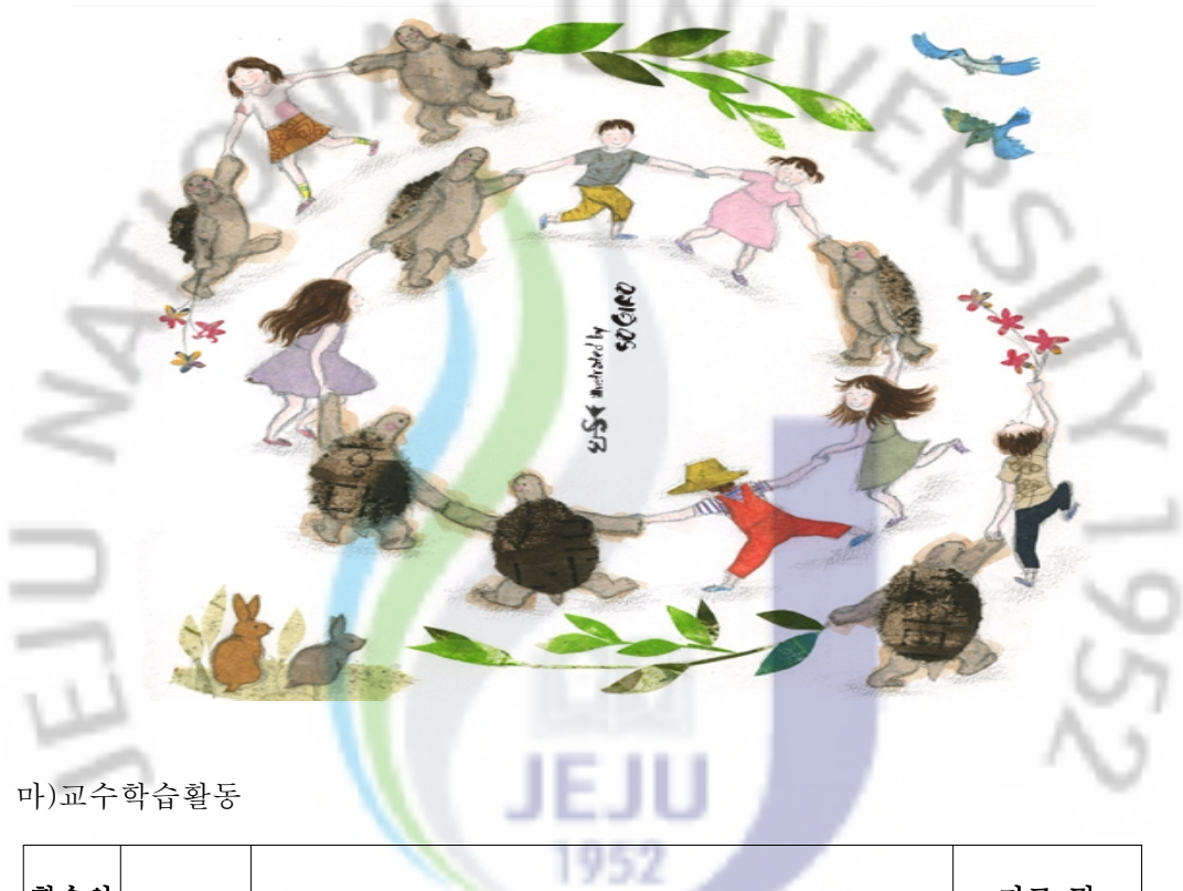
[그림 IV-2] 둥글게 손을 잡고 걸으며 노래부르는 모습

남생아 놀아라는 전래 동요로서 놀이와 노래가 함께 있는 제재곡이다. 교사는 이 제재곡에 맞는 놀이를 다양하게 구상하여 학생들이 즐겁게 참여할 수 있도록 지도하는 것이 바람직하다.