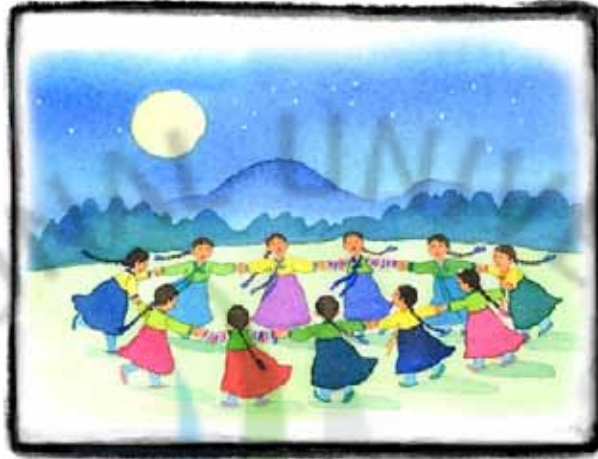
[그림 IV-7]강강술래 하는 모습