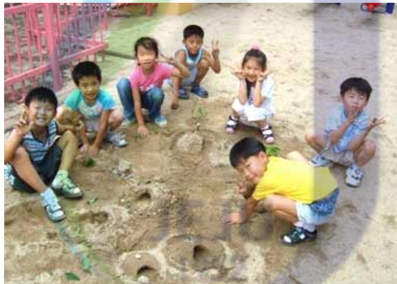
[그림 IV-6] 모래집 짓기 놀이 모습

-또는 언덕을 만든 후 막대기를 세우고 조금씩 흙을 가져다 막대기를 쓰러뜨리면 지게되는 놀이를 할 수도 있다.