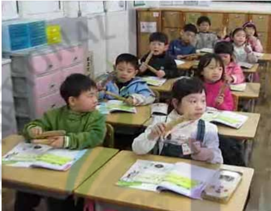
[그림 IV-1] 윷가락을 치며 노래부르는 모습