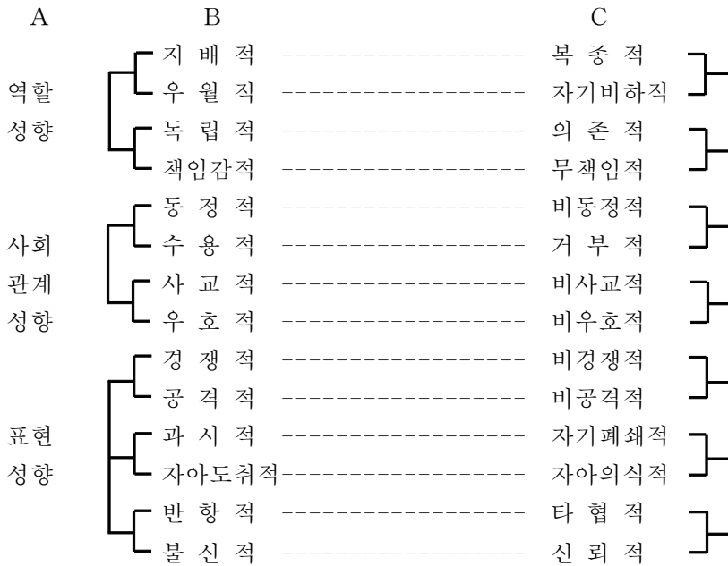
<그림 II-1> 대인관계 성향 모형 (안범희, 1984)

<그림 II-1>의 대인관계성향 모형에서 'A' 부분은 대인 관계상황에서 그가 어떤 역할을 맡으며, 그의 사회적 관계는 어떠하며, 대인 관계상황에서 그가 상대방에게 취하는 태도는 어떻게 표현되는가를 구분한 영역이며 'B' 부분은 각 성향이 어떻게 나타나는가 하는 내용을 표시한 것이다 즉 대인관계 상황에서 그가 취하는 역할이 지배적인가 복종적인가 독립적인가 의존적인가를 구분한 것으로 이러한 내용들이 곧 대인관계성향이 각 요인을 이룬다. 'C' 부분은 'B'정도가 높아지면 'C'의 정도는 자연 낮아지게 된다 결국 대인 관계성향검사는 'B'의 요인만으로 구성되게 된다 이 모형은 3가지 대인관계 영역 안에 7가지 차원의 대인관계성향 요인으로 구성되어 있으며 각 차원 별로 상단의 것은 보편성향, 하단의 것은 극단 성향을 나타낸다