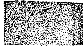
Fig.2. Waves seen in goat semen under a microscope.

6) 水素이온濃度(pH): pH의 測定은 硝子電極法 및 pH濾紙法을 併用하여 判定하였다.